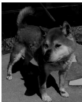
柴犬のリユウちゃん