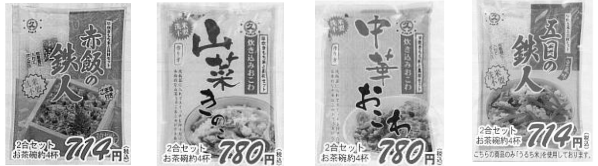
【赤飯】 【山菜きのこおこわ】 【中華おこわ】 【五目ご飯】